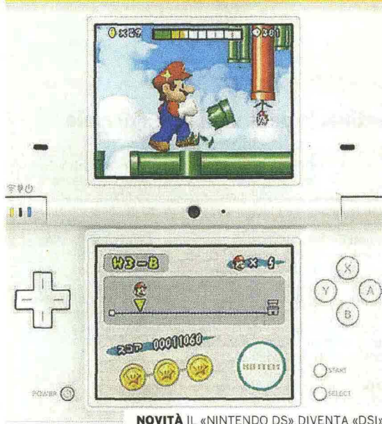
NOVITÀ IL «NINTENDO DS» DIVENTA «DSI»